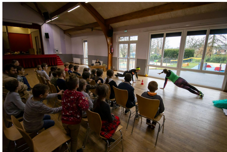
Sortie de résidence à Henriforff - 14 décembre 2023

Afin de rendre honneur aux histoires derrière les voix entendues, et parce que le spectacle se construit au fil d'interactions et de témoignages souvent pleins de surprises, un contenu audio à part entière verra le jour aux côtés du spectacle. Documentaire ou oeuvre audio plus abstraite, il donnera à entendre les histoires de chacun et jettera une autre lumière sur ce qui aura été vécu pendant la construction du spectacle.