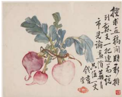
Radis, Li Shan (1686-1762), c. 1730-40, Chine, encre et aquarelle sur papier Freer Gallery of Art, Smithsonian National Museum of Asian Art

Au départ, il y a la question de la racine. Sa nature intrinsèque, la terre dans laquelle elle puise ses ressources, la main qui l'abreuve. Puis, son déploiement dans ce sujet d'étude ludique et pédagogique : le radis . Ce légume banal de la famille des crucifères pousse en 18 à 30 jours, dans un sol meuble et aéré, ce qui en fait un outil particulièrement accessible.