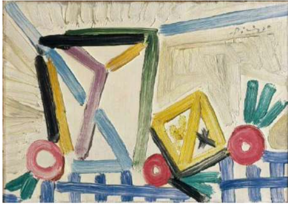
Nature morte aux radis, Picasso (1881-1973) Juin 1944, Huile sur toile, Centre Pompidou En dépôt au Musée des Beaux-Arts et d'Archéologie de Besançon depuis 1972