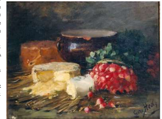
Fromages et radis, nature morte, Laura Healy Œuvre présentée au salon de 1902, Huile sur toile, Musée des Beaux-Arts de Tours

En effet, du circuit court à la grande consommation, le chemin du radis est semé d'embûches. 10 grammes de graines coûtent en moyenne 2€, pour au moins 200 unités. C'est le même prix qu'une botte de 30 radis sur un étal de marché. Au rayon des salades en sachets, prêt-à-croquer, il faut compter 10,40€/kg. À chaque étape, multiplication des intermédiaires, augmentation du prix unitaire, accroissement de l'impact carbone.