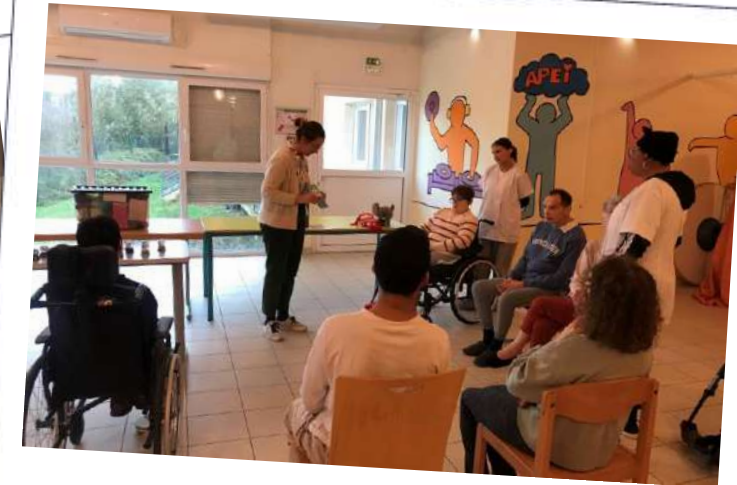
APEI de Volkrange