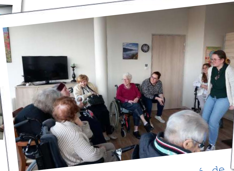
EHPAD Le Prieuré de la Fensch