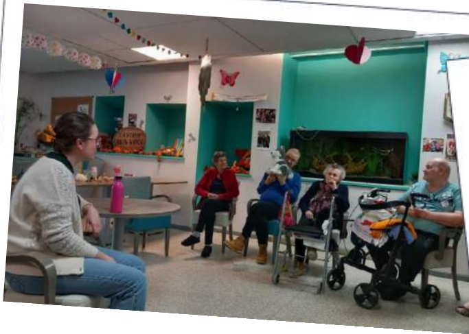
EHPAD Le Witten

Ateliers déjà menés : EHPAD le Prieuré de la Fensch, Ranguévaux ; EHPAD Le Witten, Algrange ; APEI de Volkrange. En partenariat avec la Médiathèque départementale de Nilvange (Nilvange, 57), Tatoufo - Interclubs 57.